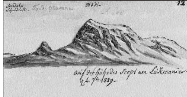
Il 1819 è Escher sin il Scopì e skizzascha il Tödi (Dödi).

Pli interessantas ch'ils panoramas èn magari las skizzas, fatgas a la svelta, forsà durant ina pausa da viadi. Escher na ha mai fatg lungas cun detagls. Las vischancas ha el sulet marcà cun ina chasa u