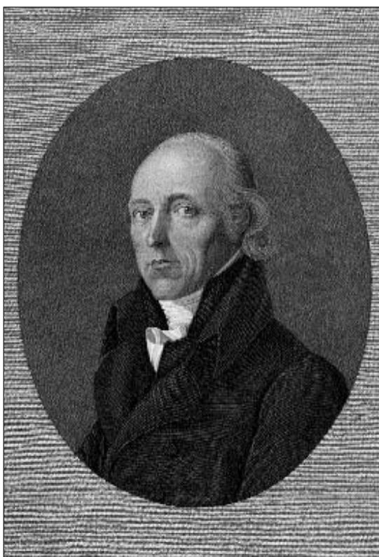
Conrad Escher von der Linth, naschi ils 24 d'avust 1767, mort ils 9 da mars 1823.

Escher aveva, sco era Goethe, studegià pliras ciencias. Pir en il 19avel tschientaner han ins separà las differentas ciencias