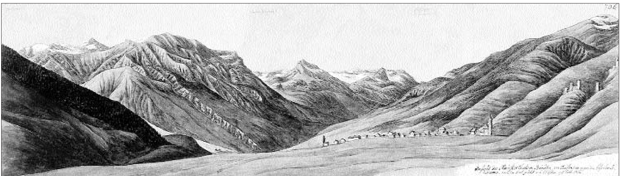
La Val Müstair a l'entschatta dal 19avel tschientaner.

Era la finanziaziun dal «Linthwerk» è stada in'ovra da pionier. Damai che la Svizra era suenter l'occupaziun tras las truppas da Napoleon bravamain sblundregiada, ha Escher proponi da finanziar il canal cun daners d'acziar. Il register d'acziar munta oz in fundus istoric economic. El inditgescha tgi che veva da lez temp insumma anc daners danvanz.